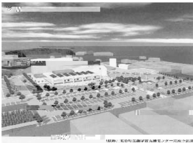
Fig.1 A perspective of the building

北谷町生涯学習支援センター (Fig.1 参照: 以下、本施設と略記する)の事業コンセプトである「国際・情報・交流-21世紀に輝くニライの都市“ちゃたん”の創造」を受け、設計業務では、学習教育、交流、および情報の受発信という3つの機能が相互に関連し合う複合施設をつくりあげることが目的とした。